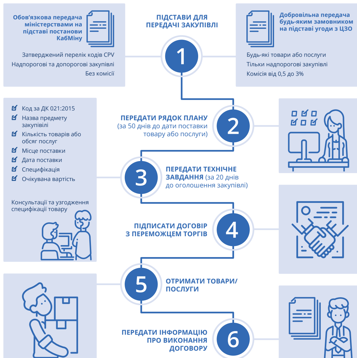
Рис. 3.1. Як передати закупівлі на ЦЗО

Як вже було зазначено, замовник може здійснити закупівлю товару та/або послуги через ЦЗО. Чіткий алгоритм дій щодо передачі закупівлі на ЦЗО представлено на рис. 3.1. 7