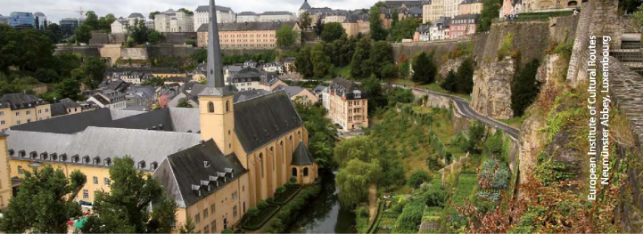
European Institute of Cultural Routes Neumünster Abbey, Luxembourg