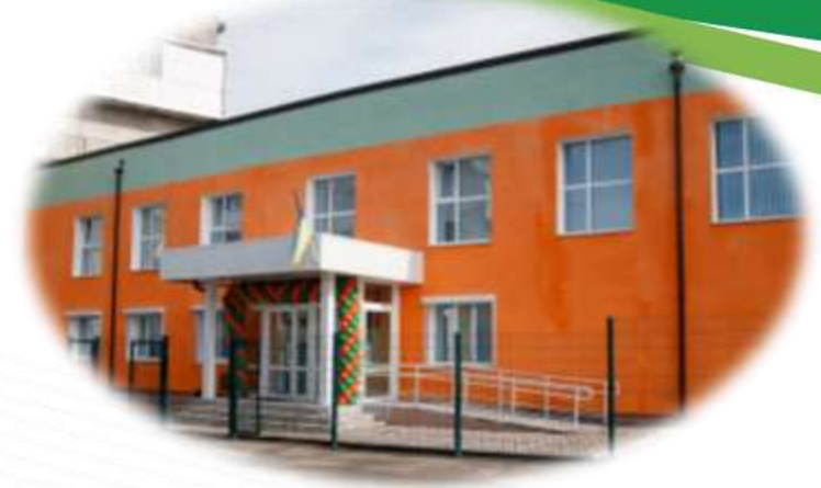
Амбулаторія ЗПСМ №2