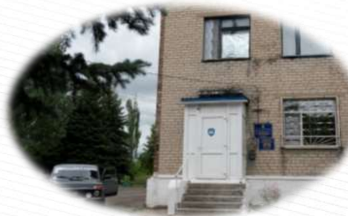
Амбулаторія ЗПСМ №3