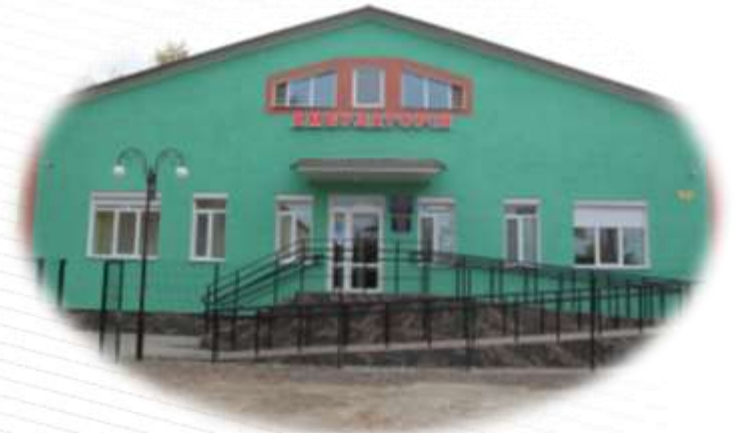
Амбулаторія ЗПСМ №6