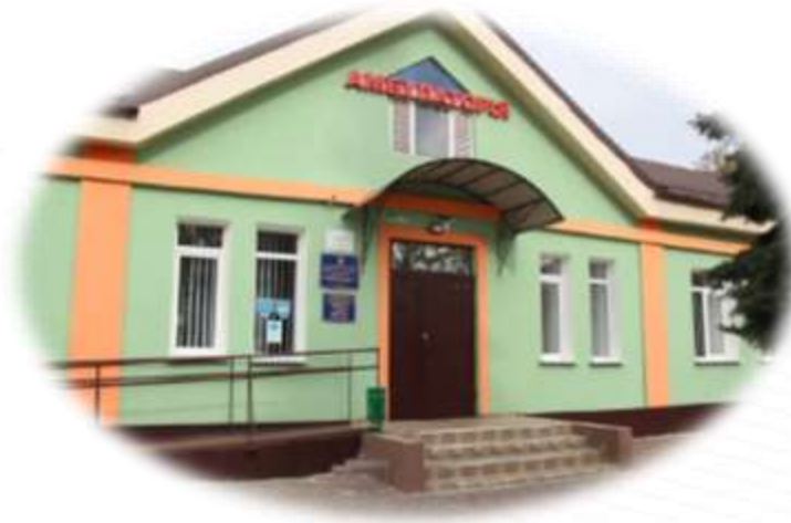
Амбулаторія ЗПСМ №1