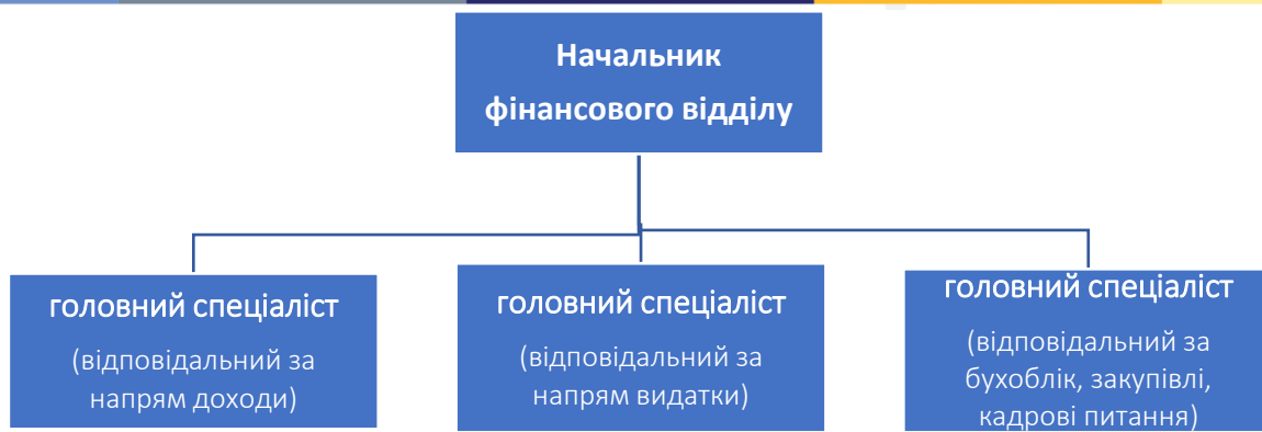
Рис. 1 Структура та чисельність фінансового відділу малочисельних громад

У структурі фінансового органу можуть створюватися відділи (сектори) і, в такому випадку, доцільно утворювати фінансовий орган у статусі управління. Така структура може застосовуватися громадами, які мають розгалужену мережу головних розпорядників, розпорядників та отримувачів бюджетних коштів. Структура фінансового органу формується таким чином, щоб була можливість забезпечувати якісне та ефективне виконання визначених законодавством повноважень, враховуючи навантаження на працівників.