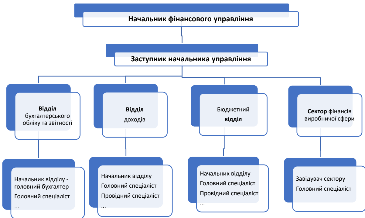
Рис. 2 Структура та чисельність фінансового управління

У структурі фінансового органу можуть створюватися відділи (сектори) і, в такому випадку, доцільно утворювати фінансовий орган у статусі управління. Така структура може застосовуватися громадами, які мають розгалужену мережу головних розпорядників, розпорядників та отримувачів бюджетних коштів. Структура фінансового органу формується таким чином, щоб була можливість забезпечувати якісне та ефективне виконання визначених законодавством повноважень, враховуючи навантаження на працівників.