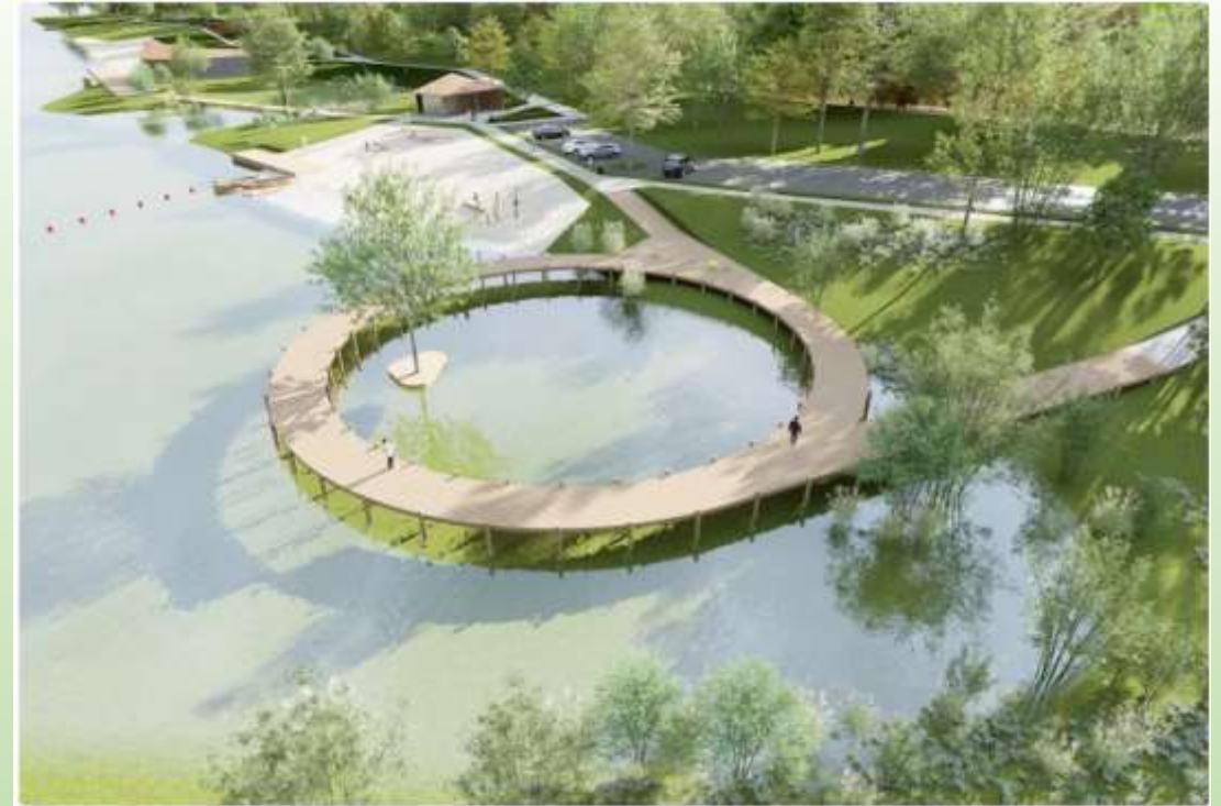
Візуалізація як може виглядати спортивно-рекреаційна зона для водних видів спорту